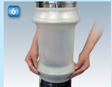
6 装着完了です。 This completes the quick release procedure.