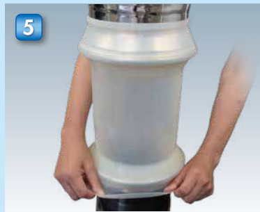
5 同じようにリップシールを均等に下ろします。 Pull the lip seal uniformly down in the same way.