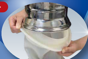
クイックリリース Quick release