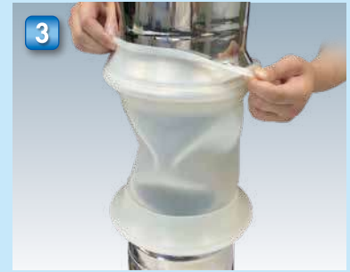
3 リップシールを上側に均等にたるみなく引っ張り上げます。 Pull the lip seal uniformly on the upper surface so that it fits tightly all around.