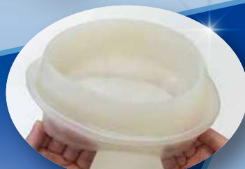
フレキシフィッティング Flexible fitting