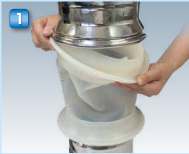
1 先ず上側から作業を開始します。 内側にシールリングを挿入します。 Start the procedure from the upper side. Insert the sealing ring inside the device.

FittingJoy's main advantage is its quick release structure. Anyone can perform a quick release. The tube-shaped flexible fitting also features a one-piece molded structure made of silicon rubber. This configuration helps to maintain extremely high levels of hygiene. The trigonal configuration of the inside and the lip seal on the outside effectively separate the inside and outside. With this separation, a high level of containment is achieved. In addition, no particles remain inside the FittingJoy after the connected device is washed. This allows for a worry-free removal of the flexible fitting.