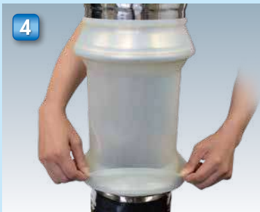
4 下部も同じようにシールリングを挿入し外リングまで確実に押し込みます。 Insert the lower sealing ring in the same way and also securely push it in the external ring.