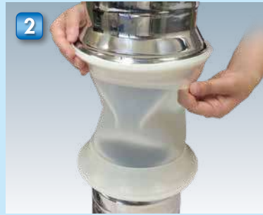
2 ジョイントアダプターの外リングに確実に嵌ったことを確認します。 Check that the flexible fitting attached to the external ring of the joint adapter is securely attached.