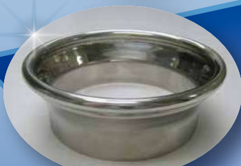
ジョイントアダプター Joint adaptor